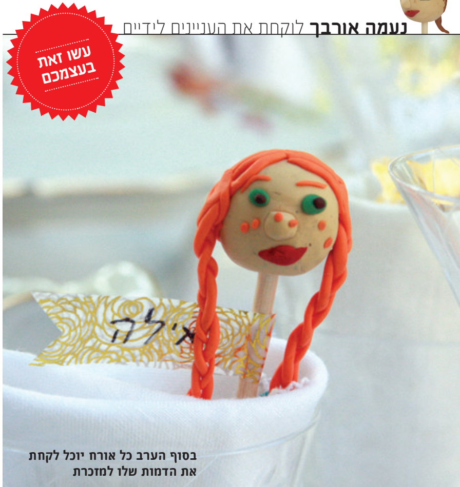
בסוף הערב כל אורח יוכל לקחת את הדמות שלו למזכרת