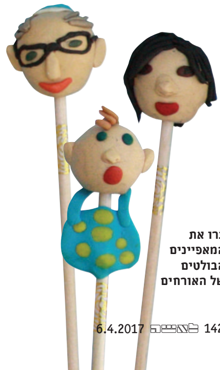
צרו את המאפיינים הבולטים של האורחים