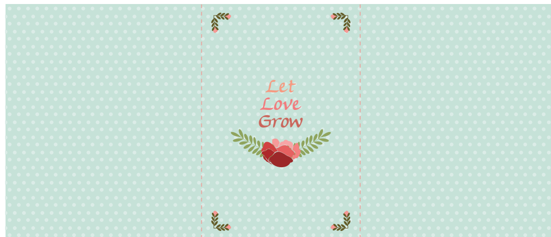
אריזה לקופסת הגפרורים הגדולה